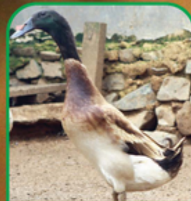
Itik Mojosari Jantan